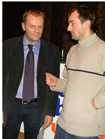
W dyskusji z Donaldem Tuskiem politycznym przeciwnikiem