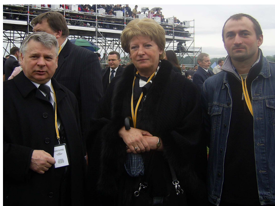
Z Hanną Suchocką i Bogdanem Borusewiczem Byłą Panią Premier i Marszałkiem Senatu