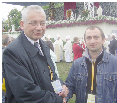
Z Ludwikiem Dornem-ministrem