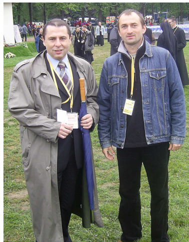
Z Bronisławem Wildsteinem Prezesem TVP