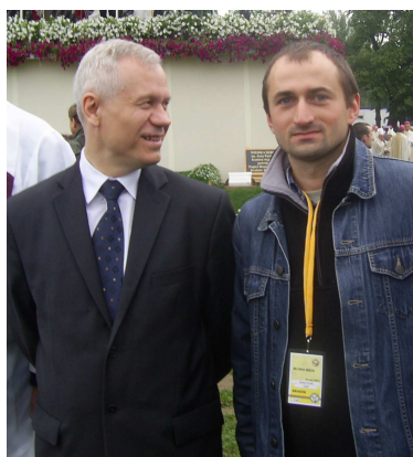
Z Markiem Jurkiem -Marszałkiem Sejmu